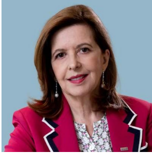
مقدمة بقلم Sophie BELLON: